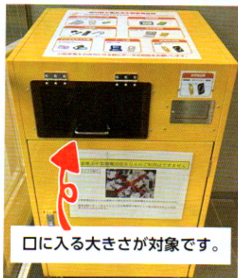
口に入る大きさが対象です。

小型家電（携帯電話、デジタルカメラなど）には、鉄、アルミ、金、銀、銅やレアメタルなど有用金属が多く含まれています。金属資源のほとんどを輸入に頼っている日本では、このまま使い捨てを続けていると将来資源不足になってしまいます。