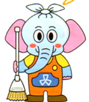
品川区清掃事務所キャラクター しながわきれいにする象