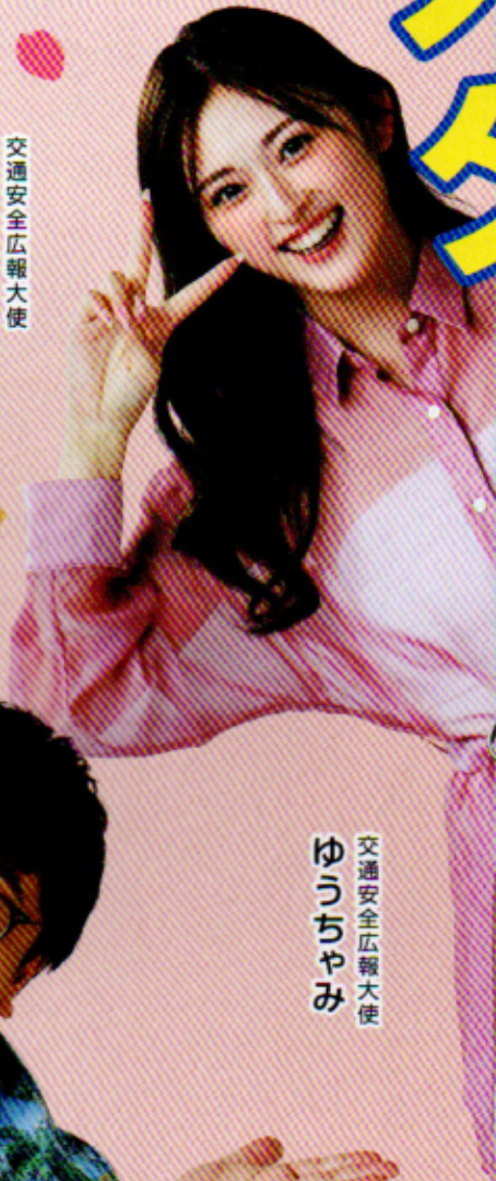
交通安全広報大使 ゆうちやみ